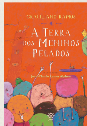
A terra dos meninos pelados – Graciliano Ramos / Ilustração Jean-Claude Ramos Alphen | 13 ago. 2014.

Ao longo do ano, poderão ser requisitados novos livros paradidáticos.